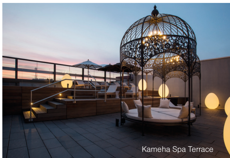
Kameha Spa Terrace

За повече информация и резервации: www.kamehagrandzuerich.com zurich@kameha.com тел.: +41 44 525 5000