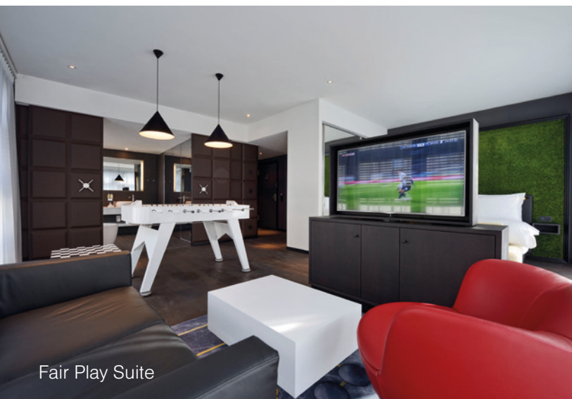
Fair Play Suite